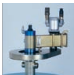
Reducerarmar möjliggör hål med diameter upp till 1000 mm