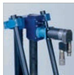
Effektiv borrning med hydraulisk matning