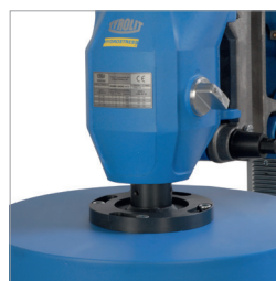
Verktögsfäste optimerat för borring av stora hål