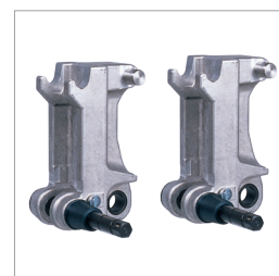
Håldiameter upp till 1 000 mm med ModulDrill distansplattor