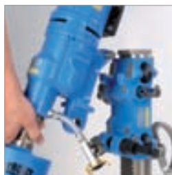
ModulDrill snabbspännsystem – snabb, enkel och säker fastsättning av bormotorn