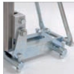
Borrning i mycket trånga utrymmen med pluggfot av stål