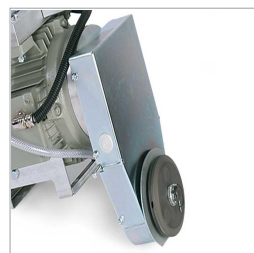
Reduktionsväxeln garanterar optimala skärhastigheter.