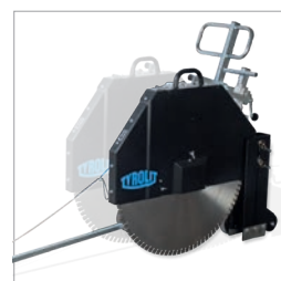
Vänster- och högerskäring.