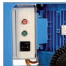
Säker tack vare högklassiga elkomponenter