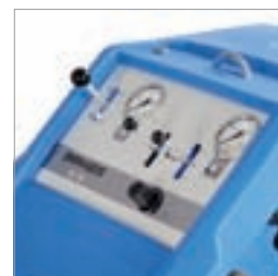
Ergonomiskt arrangerade manöverorgan